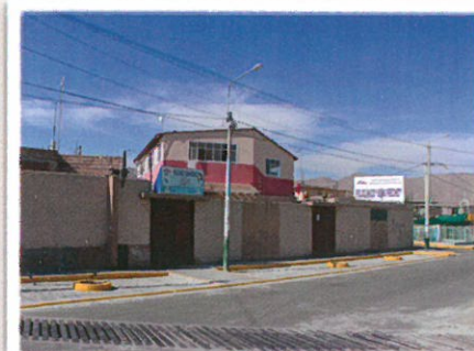
La polyclinique Jean Fréchet, dans le quartier populaire de Los Cristales.